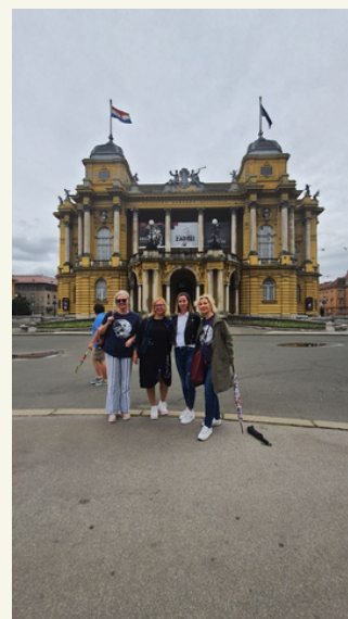
Učiteljice pred Narodnim gledališčem v ZG