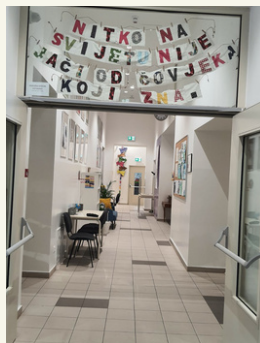
Notranjost šole OŠ Petra Zrinskog.