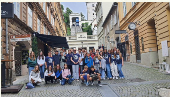
Z zagrebškimi učenci pred vzpenjačo.