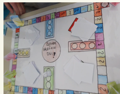
Igra, ki smo jo izdelali v projektu.